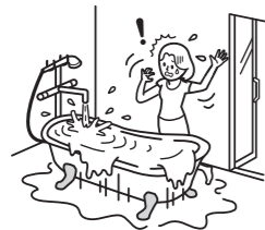
お湯を出しっぱなしで寝てしまい、水浸しになり、修理費を請求された